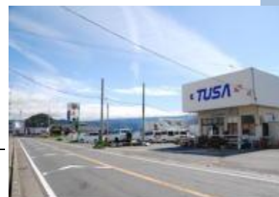
獅子浜ダイビングサービス全体