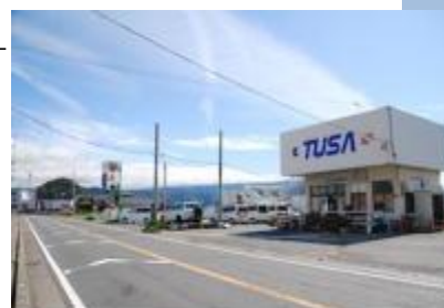
獅子浜ダイビングサービス全体